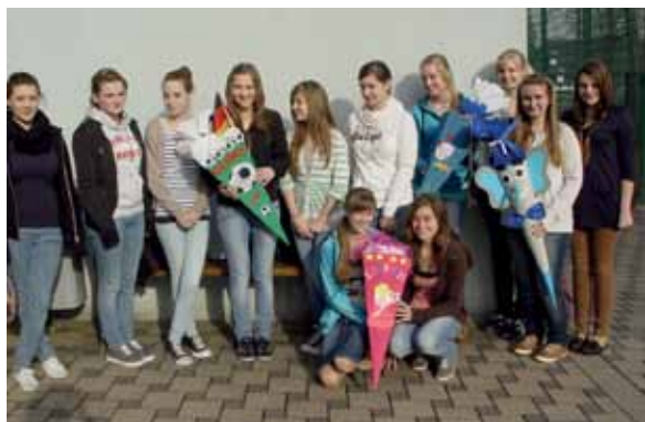
Schüler der Klassen 9 mit sehr kreativen Ideen