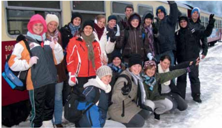
Paraguayer auf dem Brocken, Harz

Auch in diesem Schuljahr hatten wir 23 Schüler und zwei Lehrerinnen aus unserer Partnerschule in Loma Plata, Paraguay zu Besuch in den August-Hermann-Francke Schulen. Die Gastgruppe wählte eigentlich einen sehr günstigen Zeitpunkt für den Besuch, um die Weihnachtsstimmung bei Schnee und Eis zu erleben. Der letzte Winter zeigte sich aber in der Zeit vom 22.11. bis zum 15.12.2011 sehr sparsam mit Schnee. Trotz vieler Ausflüge und Highlights blieb der Wunsch nach einem Schneeseelebnis mit Schneeballschlacht und Schneemann bauen unerfüllt. Da viele der Schüler noch nie im Leben Schnee gesehen haben, wurde zum Ende des Aufenthalts eine Fahrt zum Brocken in den Harz eingeplant. Dort wurde der Traum wahr. Schnee, Sturm und Kälte konnten erst nach einer sehr langen Reise erlebt werden.