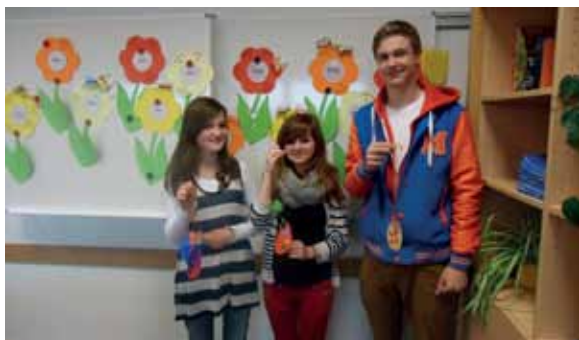
Praktikanten präsentieren ihre Ergebnisse aus der Arbeit mit KiTa-Kindern

Und wie geht es weiter? Schon sehr bald fängt die heiße Phase der Entscheidungen, der Ausbildungssuche, der Bewerbungen und Vorstellungsgespräche an. Auch hier bieten der Unterricht und das AHF-Berufswahlteam gezielte Hilfen an. Vielleicht stellt sich im Gespräch heraus, dass noch ein weiteres Praktikum nötig ist. Vielleicht helfen Eltern oder Ehemalige mit einem ähnlichen Fähigkeitsprofil weiter, indem sie von eigenen Ausbildungs- und Arbeitserfahrungen berichten oder Kontakte vermitteln.