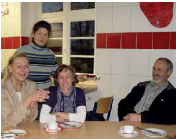
Fröhliche Gesichter bei Hausmeister, Sekretärin, Reinigungskräften und Lehrern