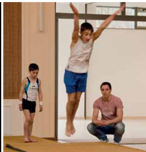
Unsere Schüler vom TuS Leopoldshöhe begeistern die Schüler mit einer Turngala