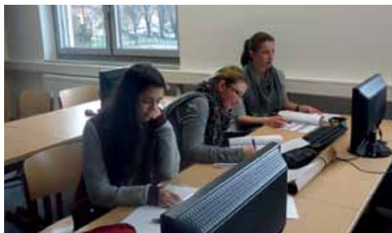
Eine intensive Vor- und Nachbereitung gehört zum Praktikum dazu