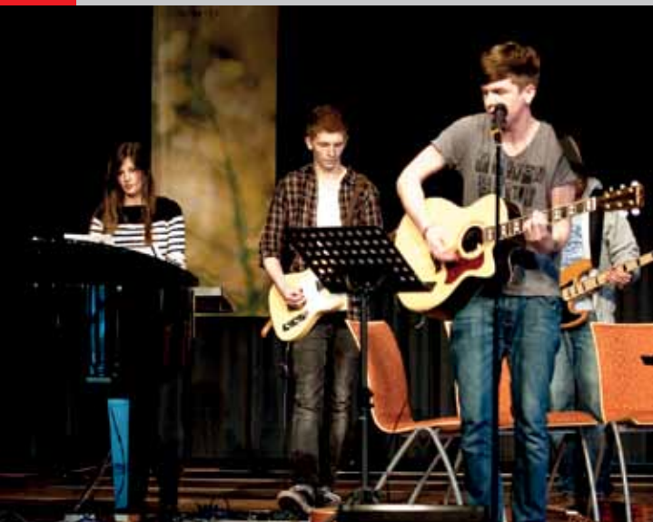
Die Band leitet den gemeinsamen Gesang an.